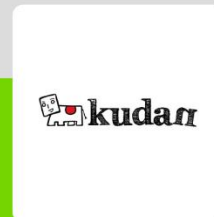
Kudan株式会社 項 大雨 代表取締役CEO