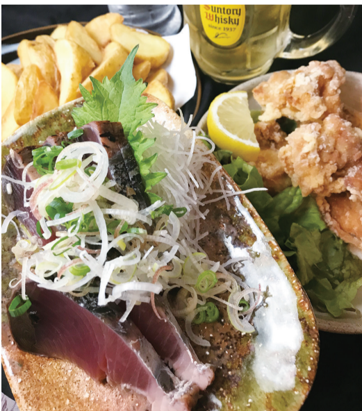
オーダーし放題!好きなだけ旬の鰹たたき、ぷりっとジューシー!