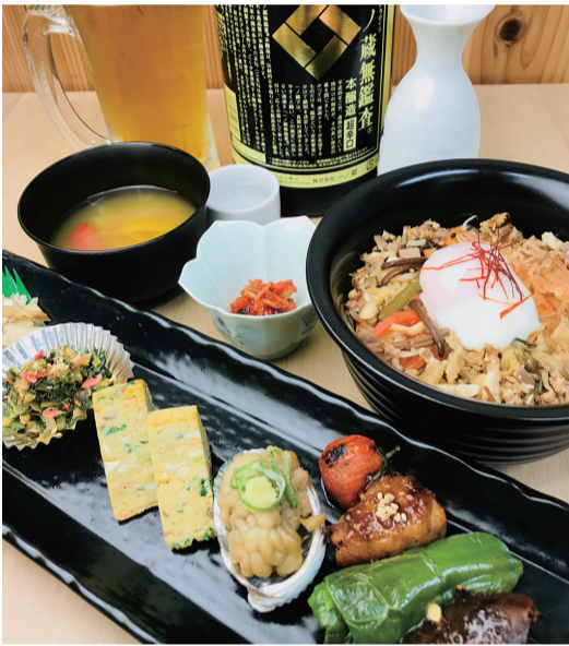
「ただいま」つい、ほっと本音の自分を受け入れてもらえるお店。