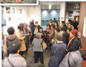
エプソンイメージングギャラリーでの 展示では、総来場者数16,320名。 1日平均710名の来場者数。