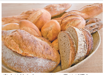
店内は焼き立てのパンの香りが漂う