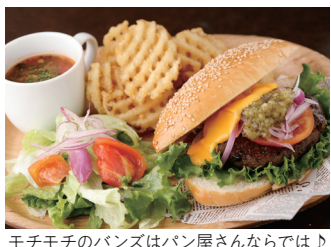
モチモチのパンズはパン屋さんならでは!