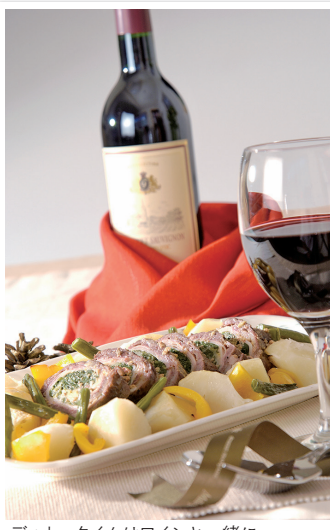
ディナータイムはワインと一緒に...