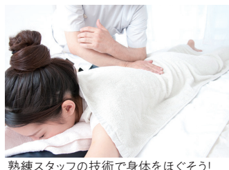
熟練スタッフの技術で身体をほぐそう!