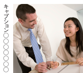
こんなアットホームな雰囲気なら失敗も怖くない！先生とおしゃべりするのが楽しみになりそう！

「子どもたちは「その場で分らないことを聞けるのがうれしい」と言います。親御さんからは「自発的に勉強するようになった」という声をよく聞きますね。何より学び喜びを感じてくれているので、塾に来るのを楽しみにしてくれています。ご紹介でご兄弟やお友達、近所の方が来てくれることも多々ありますよ。」