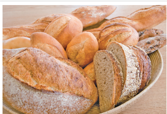
店内は焼き立てのパンの香りが漂う