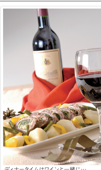
ディナータイムはワインと一緒に...