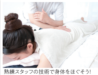
熟練スタッフの技術で身体をほぐそう!