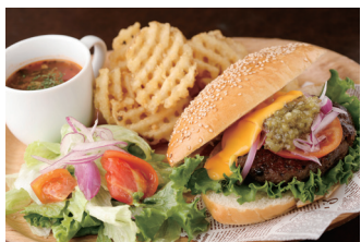
モチモチのパンズはパン屋さんならでは!