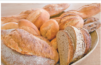
店内は焼き立てのパンの香りが漂う

あいうえおかきく けこさしすせそた ちつとにぬねのはひふ へほまみむめもやゆら りるれろわんあいうえ おかきくけこさしすせそ たちつとにぬねのは