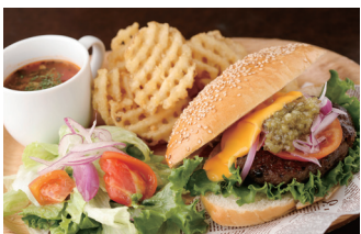
モチモチのパンズはパン屋さんならではの

あいうえおかきく けこさしすせそた ちつとにぬねのはひふ へほまみむめもやゆら りるれろわんあいうえ おかきくけこさしすせそ たちつとにぬねのは