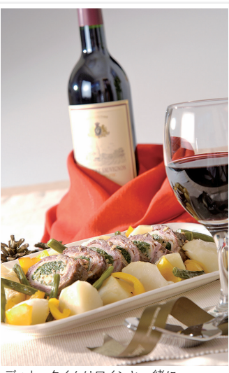
ディナータイムはワインと一緒に...

あいうえおかきく けこさしすせそた ちつとにぬねのはひふ へほまみむめもやゆら りるれろわんあいうえ おかきくけこさしすせそ たちつとにぬねのは